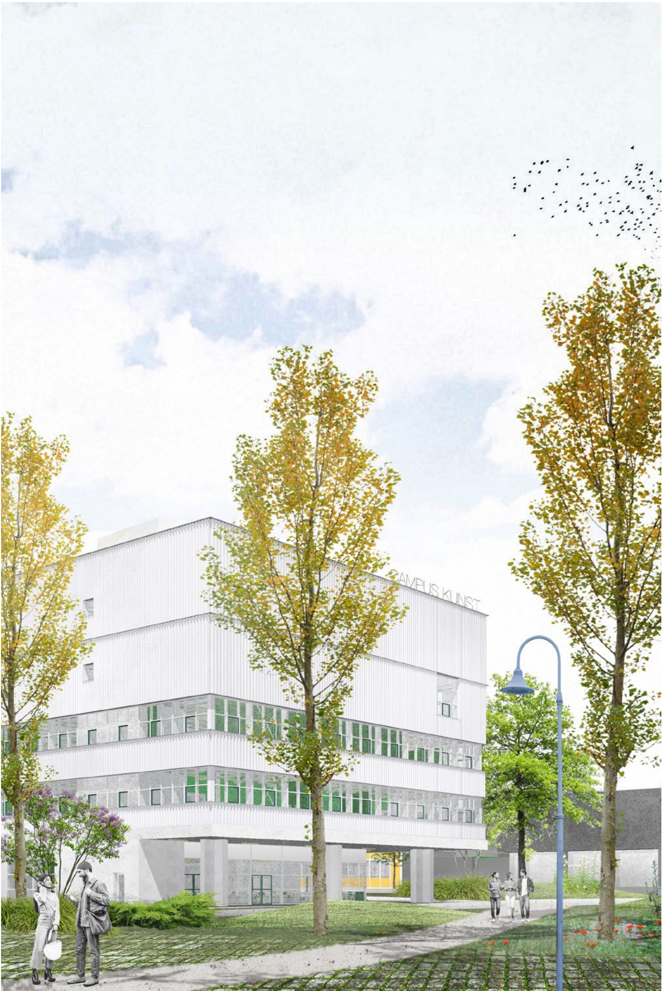
2023 - Weerbaar. Waakzaam. Wendbaar.