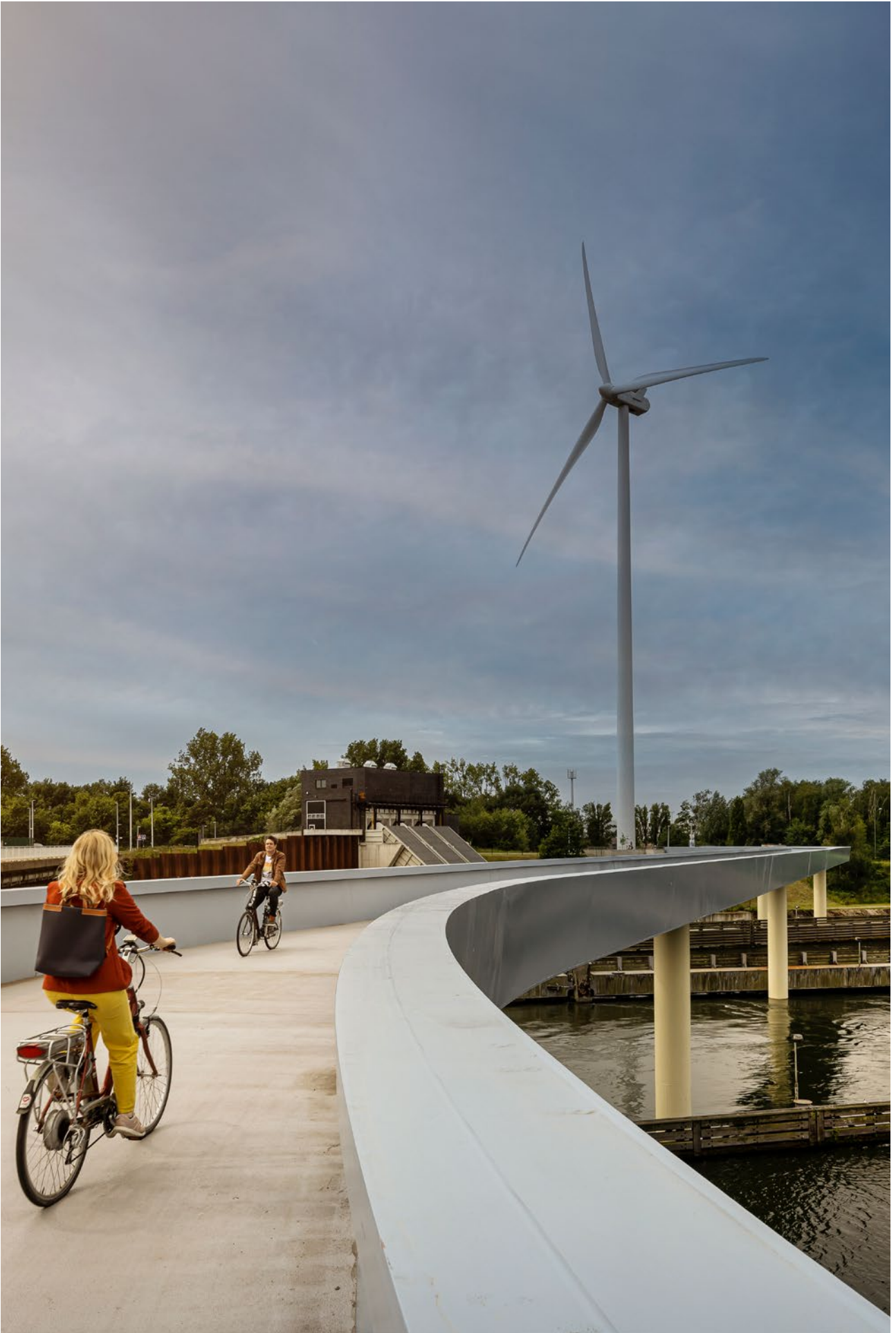
2023 - Weerbaar. Waakzaam. Wendbaar.