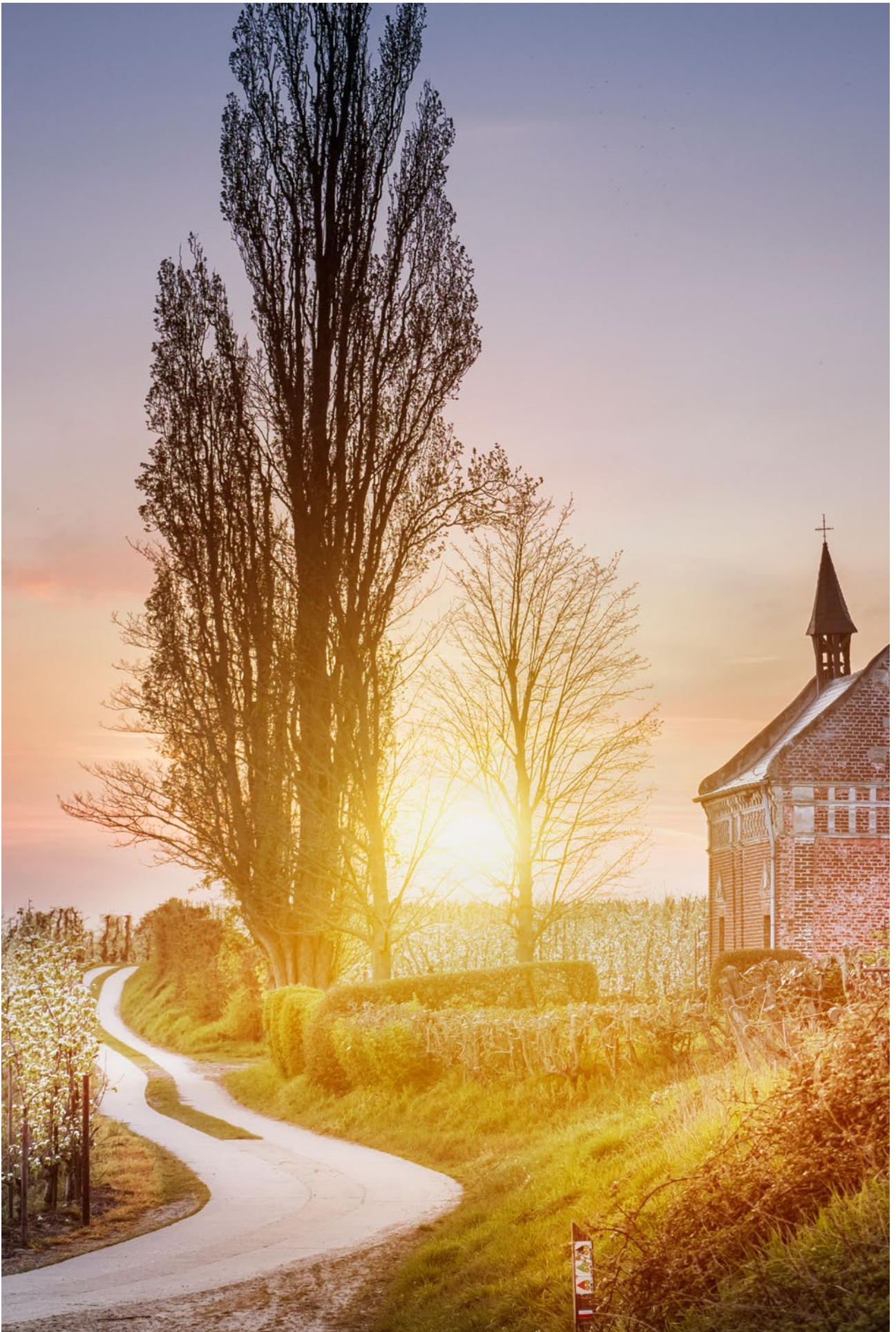
2023 - Weerbaar. Waakzaam. Wendbaar.